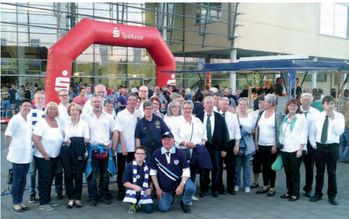
Prall gefüllter Veranstaltungskalender: Die Schützen sind immer aktiv, wie hier beim TBV in Lemgo.